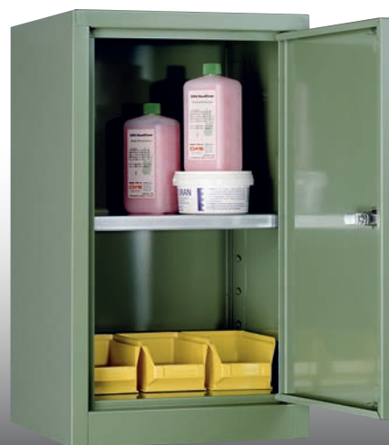
Artikel-Nr.: 2072 Gesamtbreite: 350 mm