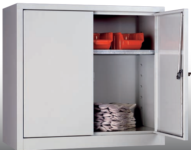
Artikel-Nr.: 2070 Gesamtbreite: 650 mm