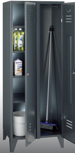
Artikel-Nr.: 7690 Abteilbreite: 350 mm