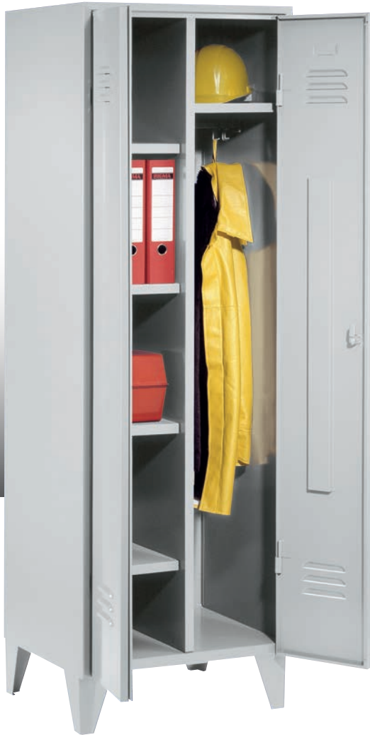
Artikel-Nr.: 7620 Abteilbreite: 300 mm