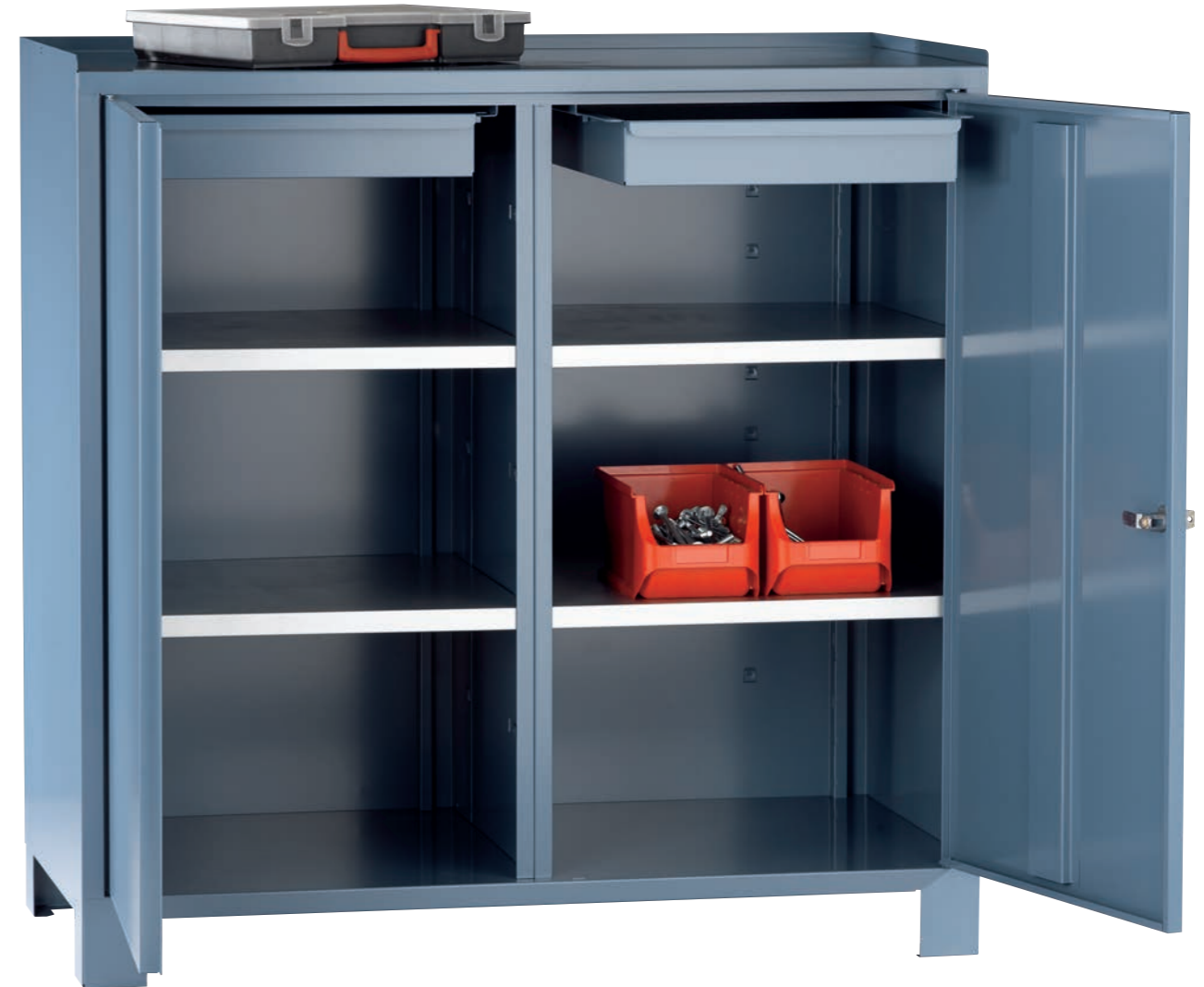
Artikel-Nr.: 5940 Gesamtbreite: 1000 mm