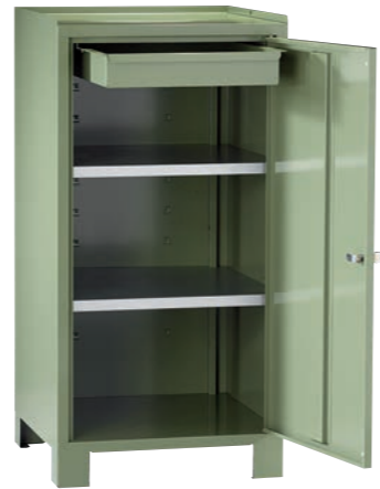
Artikel-Nr.: 5910 Gesamtbreite: 500 mm