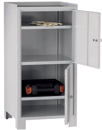
Artikel-Nr.: 5920 Gesamtbreite: 500 mm