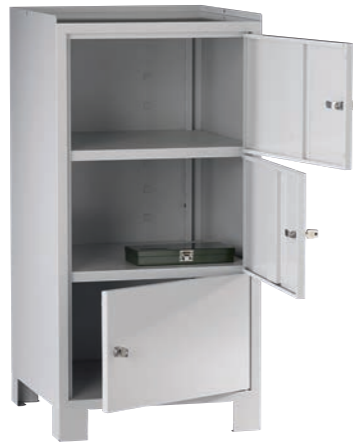
Artikel-Nr.: 5930 Gesamtbreite: 500 mm