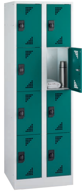
Artikel-Nr.: 7824 und 0811 Gesamtbreite: 600 mm