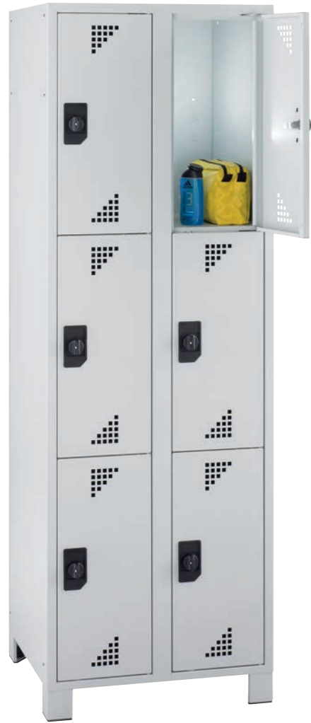
Artikel-Nr.: 7823 Gesamtbreite: 600 mm